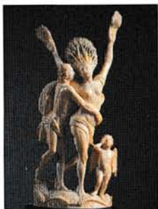
au Musée de Dieppe Apollon et Daphné (ivoire de J.A. Bellesteste)

Nous soutenons le Musée et le Fonds Ancien et Local : dons des Amys du Vieux Dieppe