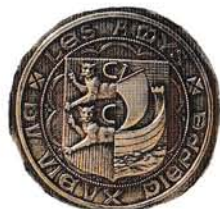
Blason apposé sur la Borne du Canada