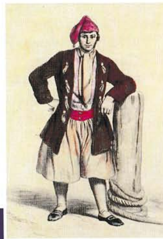
« Pêcheur poletais »

Vous pouvez aussi adhérer en ligne sur notre site internet et payer par Paypal.