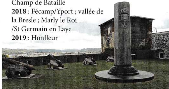
Colonne Jean Ribault érigée en 1935