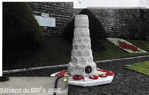
Borne Dieppe-Canada érigée le 27 août 1927 par les A.V.D.

Les Amys du Vieux Dieppe En souvenir de la visite des Pèlerins canadiens le 25 Août 1926