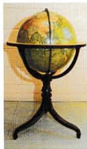
au Fonds ancien Globe Bardin